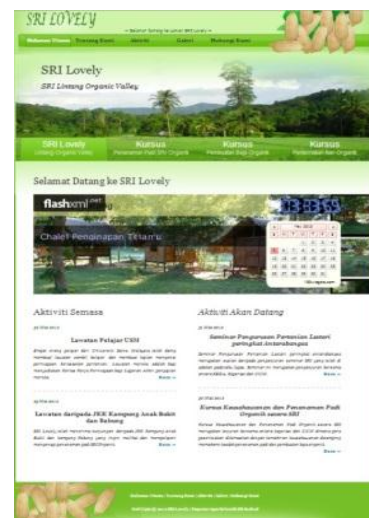
Rajah 2: Laman Sesawang Syarikat Lovely Farm

Hasil kajian yang diperoleh adalah hasil temu bual dari responden pertama iaitu pegawai ICT dari pusat komputer UUM. Beliau berkata, sesebuah laman sesawang yang baik perlu memiliki paparan yang menarik selari dengan objektif perniagaan yang dijalankan.