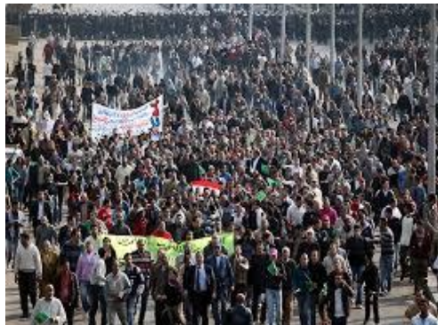
Fig. 3. Demonstrasi jalanan rakyat yang menuntut hak-hak kebebasan dari rejim pemerintah