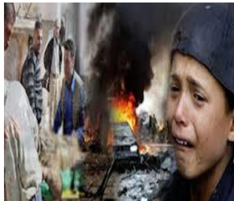
Fig. 1. Peristiwa 'Arab Spring' menyebabkan kemusnahan harta benda