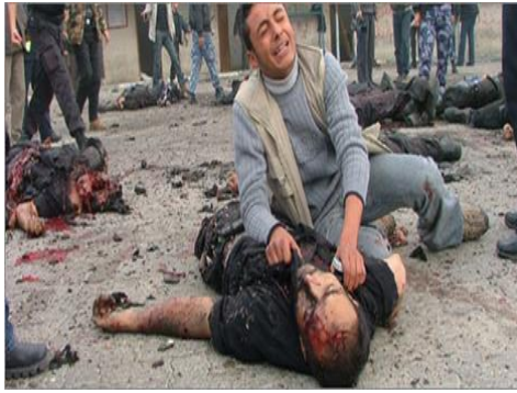
Fig. 2. Pergolakan yang berlaku meragut banyak nyawa