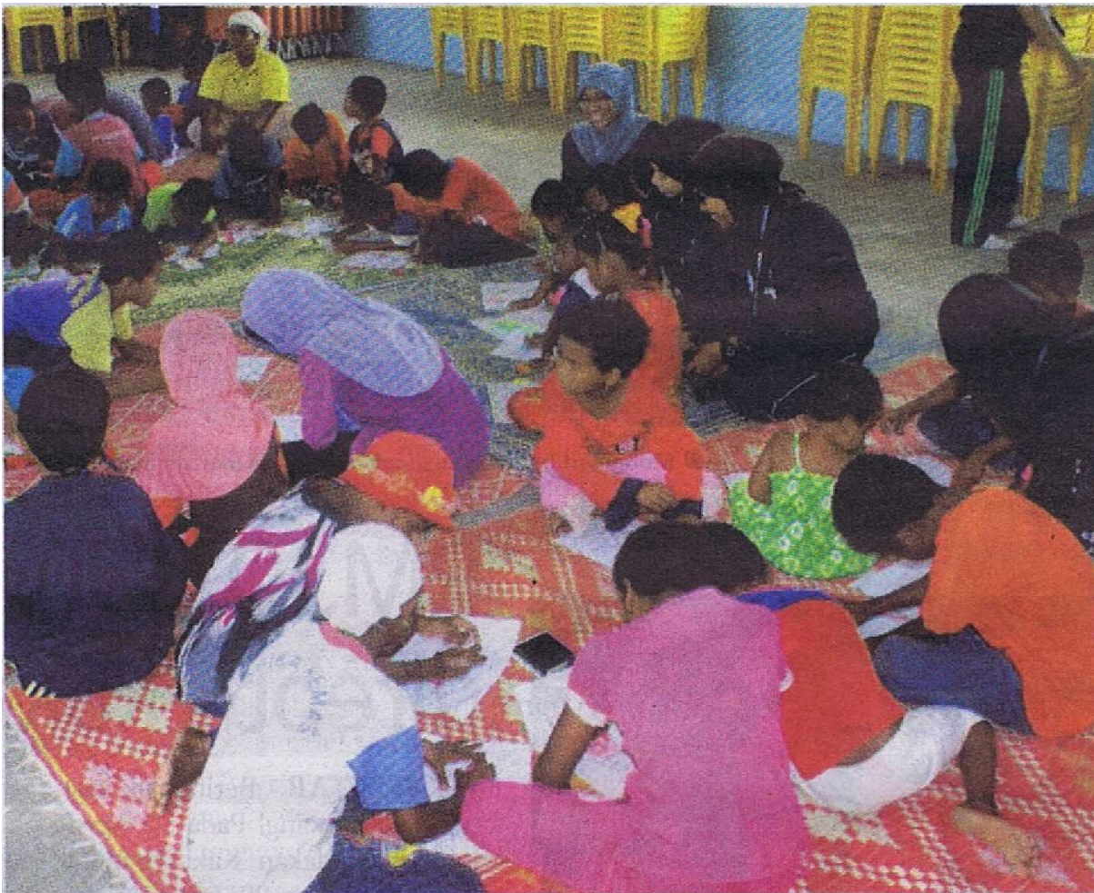
■ Peserta program mengaplikasikan apa yang dipelajari di universiti kepada masyarakat Orang Asli.