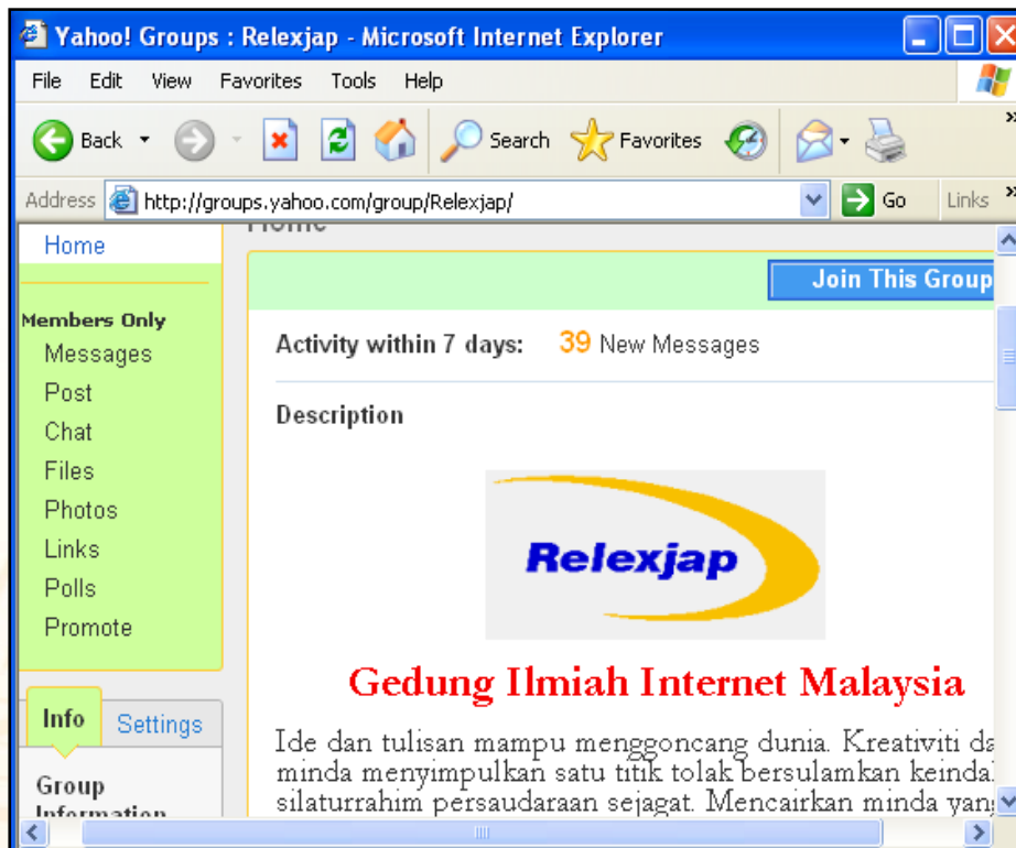
Rajah 2: Gedung Ilmiah Internet Malaysia.