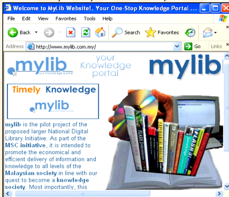
Rajah 1: Projek Multimedia Library Link .

Projek perintis ini dikenali sebagai Mylib telahpun melalui peringkat ujian dan Perpustakaan Digital sepenuhnya diperkenalkan pertengahan tahun 2001. Hakikatnya, projek Mylib yang menggunakan Sistem Perpustakaan Digital Kebangsaan (SPDK) tersebut boleh diakses pada alamat http://www.mylib.com.my dan untuk itu, ia akan menjadi pusat sehenti kepada pangkalan-pangkalan data pengetahuan yang terbesar di rantau ini. Rajah 1 merupakan laman utama projek Mylib tersebut.