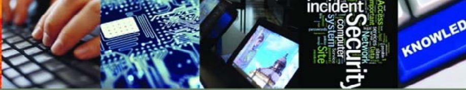
Rajah 4: The Globethics.net Library.