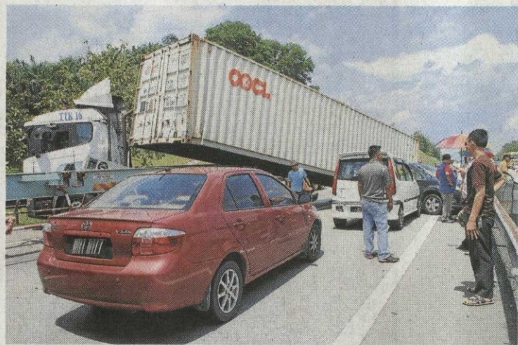
▲这辆丰田轿车因及时煞车而未牵涉入车祸中，但车主却被卡在两辆发生事故的罗里之间，无法动弹。

最让人惊讶的是，一辆处在两辆罗里中间、位列两辆轿车后端的丰田轿车，竟然未与任何轿车发生触碰，只是在事发后因被卡在中间，而暂时无法离开现场。