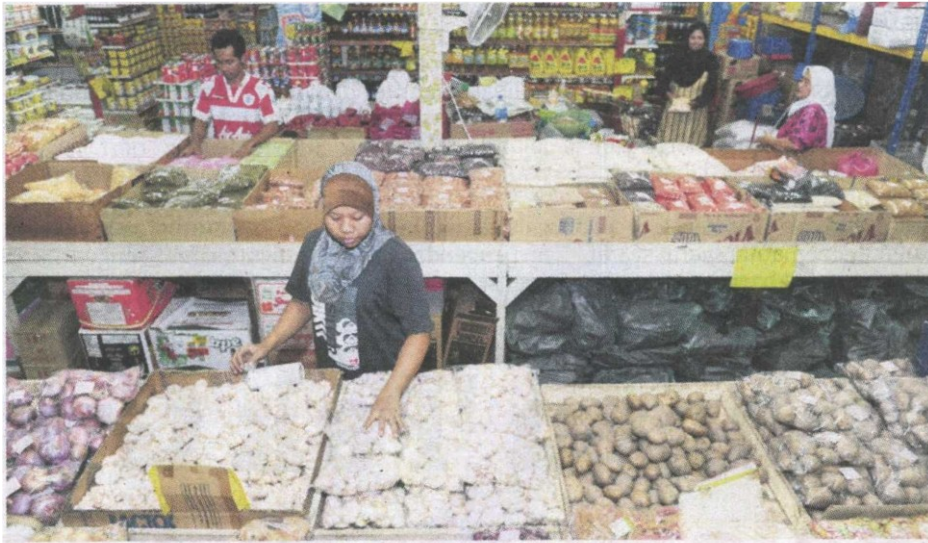
Barangan makanan asas terselamat dari dikenakan GST.