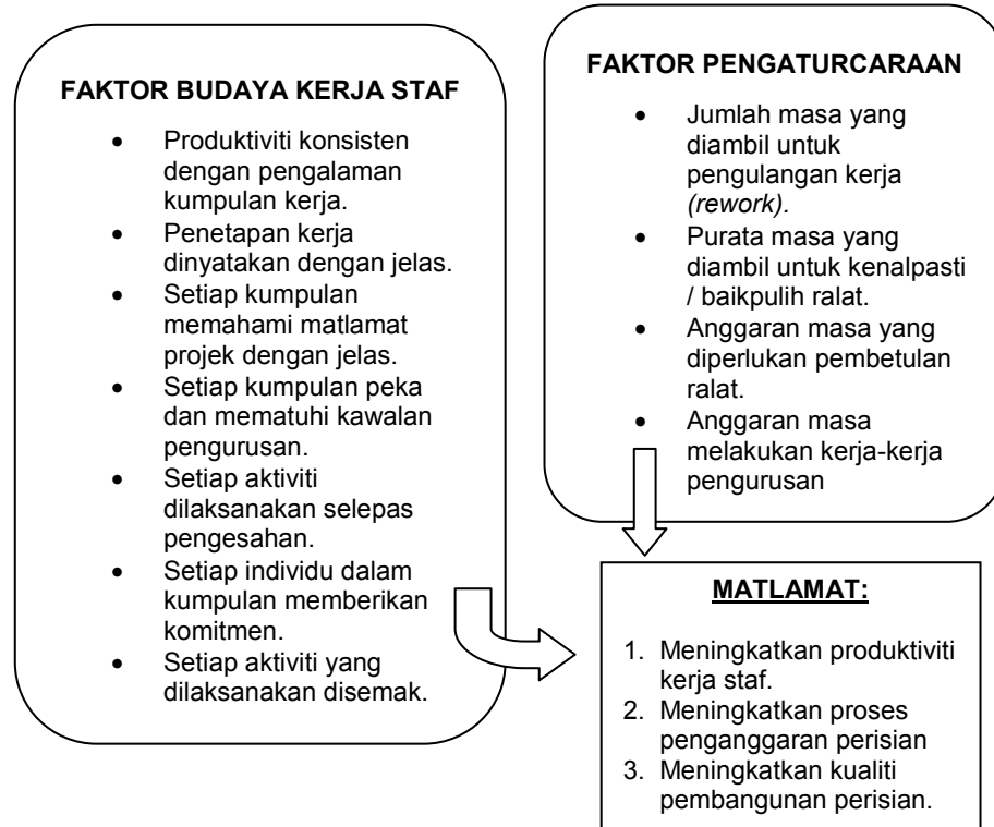
Rajah 3: Model pemantauan prestasi pengurusan projek perisian

Nilai peratusan yang tinggi disebabkan staf tidak menggunakan masa yang lama dalam melakukan sesuatu aktiviti seperti pembetulan ralat dan pembetulan modul. Semakan yang terakhir masih lagi tidak menunjukkan nilai peratusan yang memberangsangkan kerana berlaku penurunan sebanyak 14.29% pada semakan ketiga. Ini kerana terdapat masalah yang tidak diambil tindakan susulan dengan segera iaitu pengulangan kerja semasa pembinaan modul.