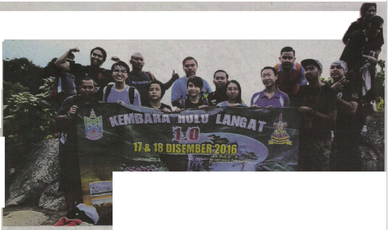
PESERTA Kembara Hulu Langat 1.0 bergambar kenangan di puncak Bukit Broga.