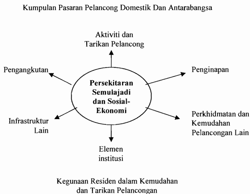
Rajah 5 : Klasifikasi Komponen Perancangan Pelancongan

Sumber : Edward Inkeep, (1991). Tourism Planning : Integrated Approach and Sustainable Development , 1991