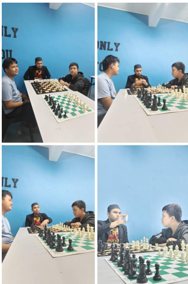
Gambar Rajah 1. Pelaksanaan dan pengujian permainan ChesSirah