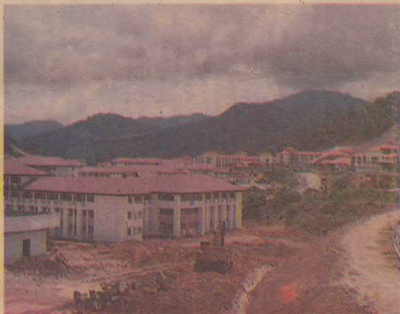
KAWASAN berbukit bukau dengan pokok - pokok hutan hujan tropika meng-hijau melatari pemandangan indah kampus Sintok UUM.

Dalam keadaannya yang belum seratus peratus siap sekarang ini pun setiap orang yang melihatnya sudah mengiktiraf akan keindahannya, kampus Sintok dijangka membangun menjadi sebuah kampus yang paling cantik di dunia sebelah sini beberapa tahun lagi.