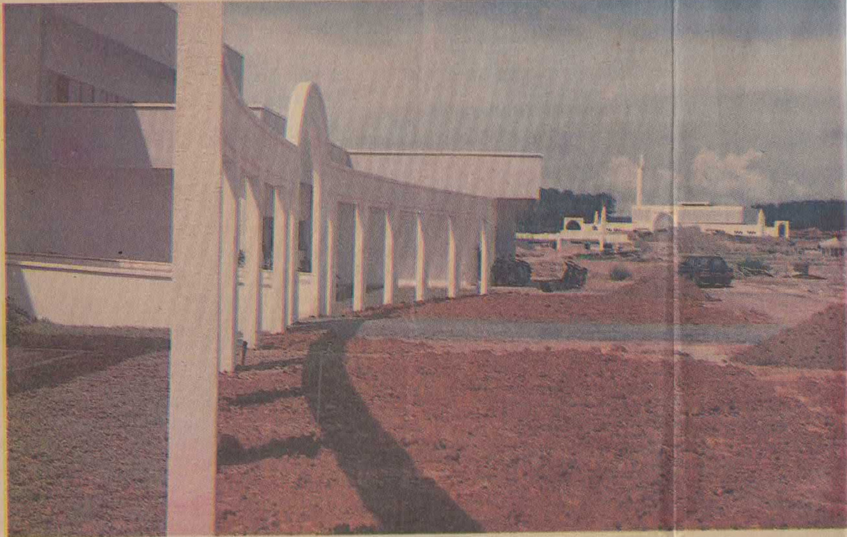
MASJID universiti tersergam indah di tebing bukit sebelah barat kampus UUM dilihat dari pintu gerbang bangunan hal ehwal pelajar.